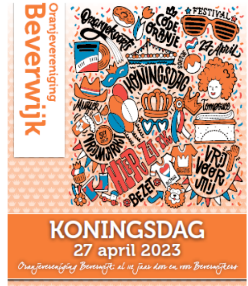
Figuur 1: voorpagina Oranjekrant

Het belangrijkste medium om de Koningsdag activiteiten bekend te maken is toch wel onze Oranjekrant. Voor de jaren 2023-2025 is de overeenkomst met uitgeverij & drukkerij MDH vernieuwd. Dat betekent een gratis verspreiding van 16000 exemplaren in de gemeente Beverwijk met de inhoud aangeleverd via de Oranjevereniging. Dat betekent in de maand maart veel werk om de bijdragen allemaal te verzamelen en door te sturen. In goede samenwerking met de vormgever wordt dan opmaak en inhoud gecontroleerd. In het weekend 2 weken voor Koningsdag is de Oranjekrant bezorgd in het reclame/folderpakket. Juist vanwege de vele ja/nee en nee/nee stickers en ook het tekort aan bezorgers krijgt de Oranjevereniging 1000 exemplaren voor eigen distributie.