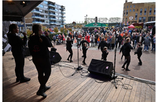
Figuur 10 Masal meiden laten zien wat ze kunnen

Naast de optredens was op het Stationsplein weer gezorgd voor diverse attracties: skelterbaan, suikerspin en schminken.