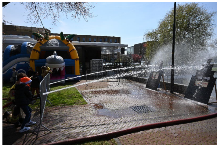
Figuur 11 Oefenen met brandje blussen

De dierenambulance was wederom aanwezig. Bij de Jeugdbrandweer konden de kinderen met echte brandslangen aan de slag om een “brandje” te blussen. Maar ook in een brandweerwagen even achter het stuur zitten. De Scouting hielp mee met een eigen broodje te bakken. Bestuursleden van de Oranjevereniging liepen met munten op zak waarmee bij Leek een ijsje kon worden gehaald. De jongens en meisjes van de brandweer en scouting waren er als eerste bij maar dat hadden ze ook wel verdiend want ze hadden de avond van tevoren al geholpen met de hekken en zouden dat weer doen na afloop. Naast de optredens was op het Stationsplein weer gezorgd voor diverse attracties: skelterbaan, suikerspin en schminken.