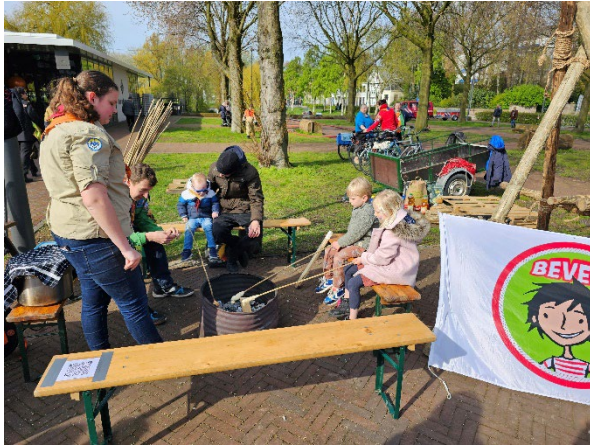
Figuur 12 Broodjes bakken bij de scouting