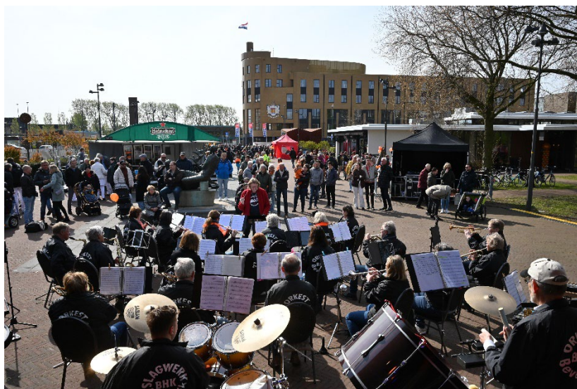
Figuur 8 Het Orkest van de BHK in actie

De drukte op het plein neemt dan ook altijd weer toe, opa's en oma's, vaders en moeders, alles komt kijken naar wat hun familieleden aan mooie "kunsten" kunnen vertonen.