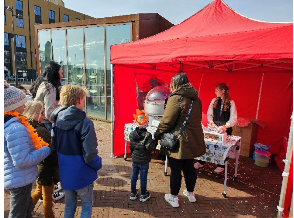
Figuur 13 lekker gratis suikerspin