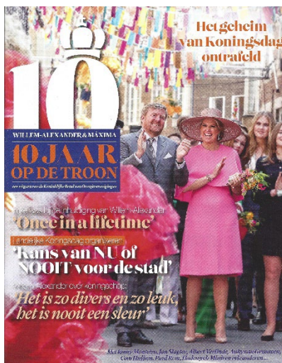
Figuur 2: Magazine t.g.v. 10 jaar Koning Willem Alexander

Vanaf woensdag 12 april 2023 hebben bestuursleden een rondje gemaakt langs bibliotheek, stadhuis, verzorgingstehuizen, Paviljoen Westerhout ed. om te zorgen dat mensen alsnog een exemplaar konden bemachtigen.