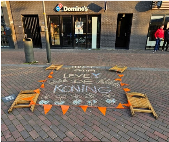
Figuur 5 Een plekje gereserveerd?

is gecontinueerd en zorgt ervoor dat vele overgebleven spullen nog een tweede leven krijgen. Vrijwilligers van Noppes stonden met hun vrachtwagen vanaf 12.00 uur weer klaar om alles mee te nemen wat niet meer mee naar huis mocht.