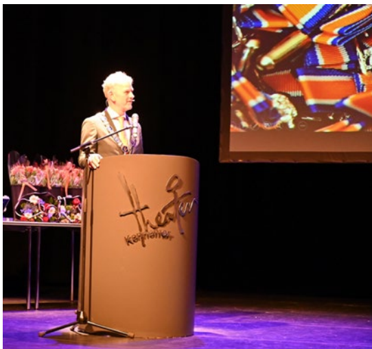
Figuur 4: uitreiking koninklijke onderscheidingen in Kennemertheater