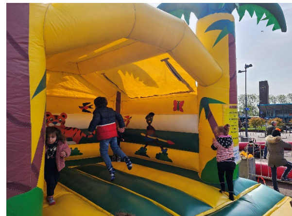
Figuur 15 Een speelkussen doet het altijd goed