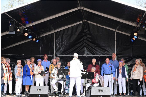
Figuur 9 Smartlappenkoor terug van weggeweest