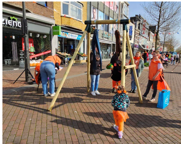
Figuur 6 Spijkerbroekhangen